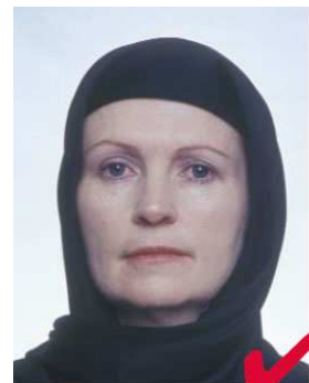
nr 6: religiøst hodeplagg riktig