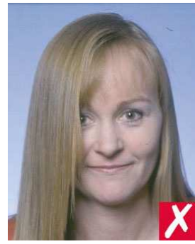
nr 3: hår skjuler øynene