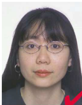
nr 5: briller OK