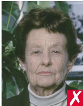
nr 1: urolig bakgrunn