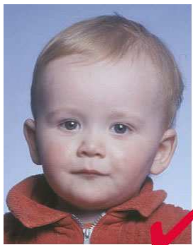
nr 4: barn, kvalitetskrav som voksen